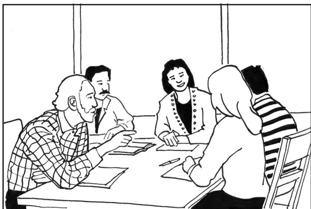
Vijana wakiwa kwenye mjadala

inayowakabili ( Kuona ), athari zake ( Kubukumumu ) na kubuni njia za kuibadili ( Kutenda ).